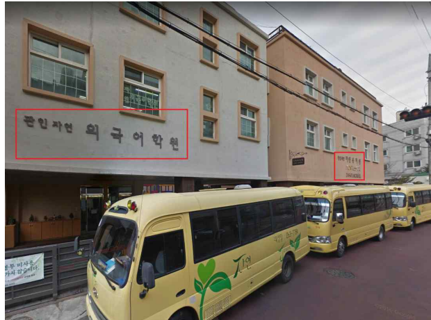
[그림7] 설립자가 동일한 용인 죽전 자연유치원과 외국어학원이 나란히 위치한 모습

사례 ⑤ 경기 군포 창의마을 유치원은 원장의 배우자가 운영하는 학원에서 영어 특성화 교육을 실시하였습니다. 또한 해당 영어 수업 이후 학원차량을 이용하여 귀가하여야 함에도 유치원 통학차량을 이용하여 귀가하도록 하였고, 학원과의 계약 관계없이 불법으로 유치원 통학차량을 이용하도록 하였으며, 임차료 및 차량 유지비 전액을 유치원 교비에서 집행하고, 그 외 해당 학원의 각종 공과금 및 유지보수 용역료를 유치원 회계에서 부당 집행하여 경고 처분을 받았습니다.