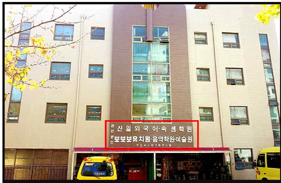
[그림2] 사립유치원 원장이 한 건물 내에서 학원을 겸업하는 사례

실제로 해당 유치원의 홈페이지에 들어가보니 각종 학원교육을 ‘자매교육기관’이라고 소개(그림)하며 외국어, 보습, 속셈, 피아노, 미술, 발레 등의 여러 교육과정을 운영하고 있었습니다. 유치원인지 학원인지 분간이 가지 않았습니다. 그리고 이를 운영하면서 ‘성적향상’을 위해 ‘보충수업’을 실시하고, ‘영어 문법 지도’와 함께 ‘수학 수준별 그룹 지도’, Level구분 및 평가 테스트를 하는 것이 과연 유아에 대한 교육적 이해가 바탕이 된 교육인지 의문이 들지 않을 수 없습니다. 또한 2015교육과정 개편으로 인해 초등학교 1학년의 한글교육 시수가 늘어나 취학전 한글교육 선행없이도 초등학교 입학 후 학교 적응에 문제가 없도록 교육부 차원에서 많은 노력을 기울이고 있는 바, 유치원 교육에서 여전히 한글 교육 및 받아쓰기 교육에 치중하는 모습은 시정되어야 합니다.