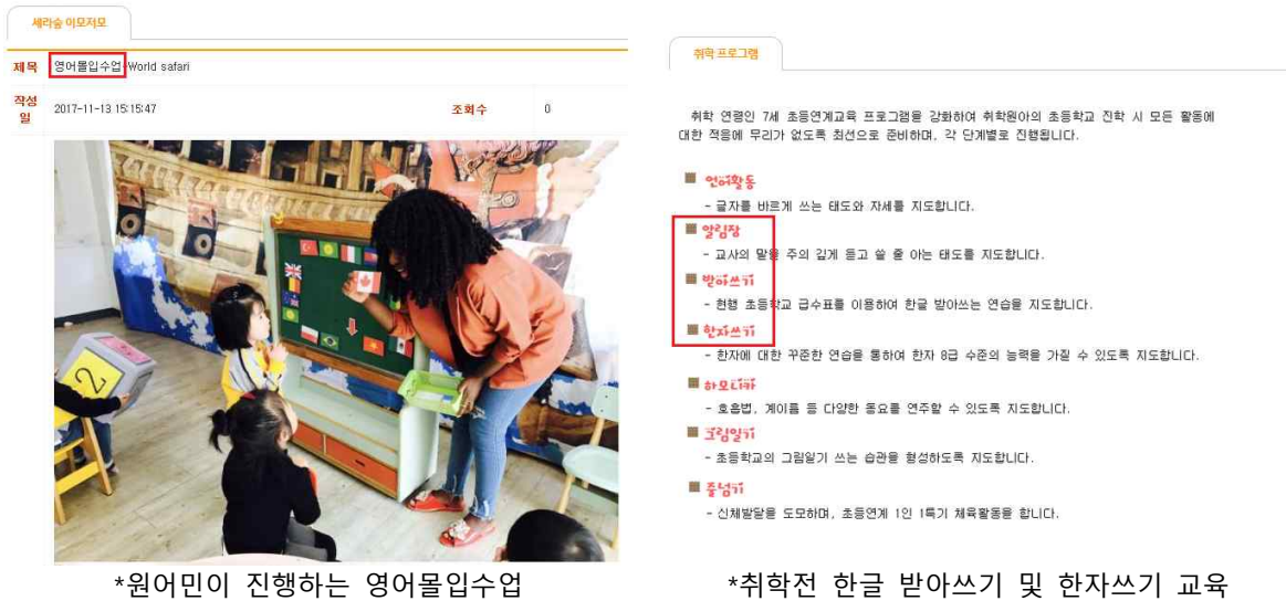
[그림6] 안산 세라숲 유치원의 영어 몰입교육 및 한글/한자 선행교육 홍보