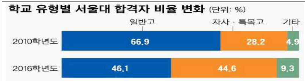
[그림2] 학교 유형별 서울대 합격자 비율 변화