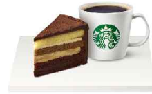
이벤트 상품 스타벅스 기프트콘(20명)