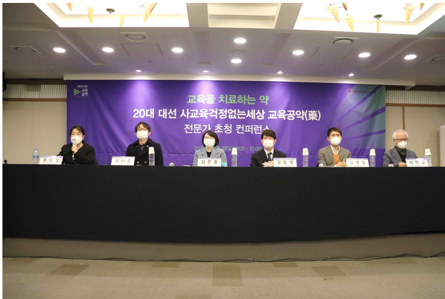
제1세션 '공정교육을 위한 4대 공약'이 진행되는 모습