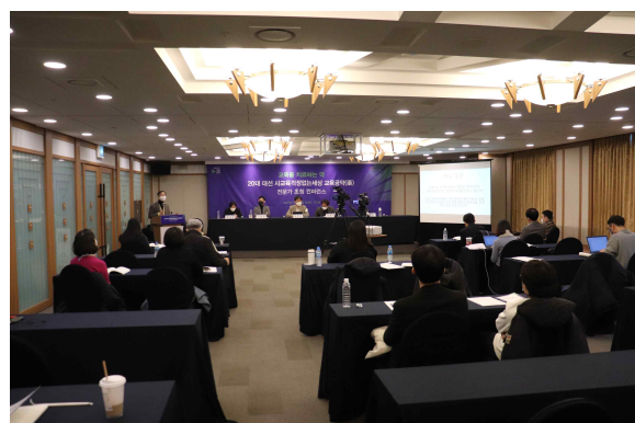
좌: 제2세션 ‘책임교육을 위한 4대 공약’이 진행되는 모습/ 우: 컨퍼런스 행사장 전경