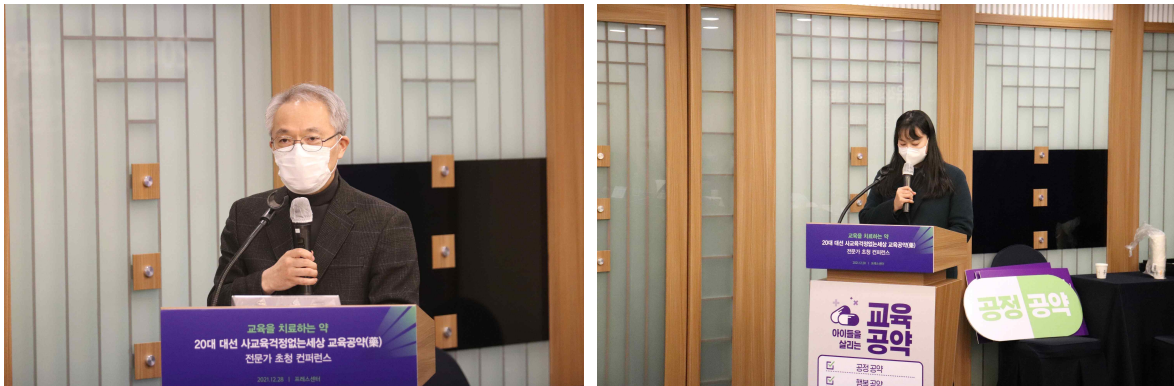
좌: 송인수 사교육걱정없는세상 이사장의 개회사/ 우: 사회를 맡은 정지현 사교육걱정없는세상 공동대표

컨퍼런스는 송인수 사교육걱정없는세상 이사장의 개회사와 정지현 사교육걱정없는세상 공동대표의 사회로 시작하였습니다. 컨퍼런스의 진행은 총 세 세션으로 나뉘어 이루어졌으며, 제1세션에서는 ‘공정교육을 위한 4대 공약’을 다루고, 다음으로 제2세션에서는 ‘책임교육을 위한 4대 공약’을, 마지막으로 제3세션에서는 ‘행복교육을 위한 3대 공약’을 다루었습니다.