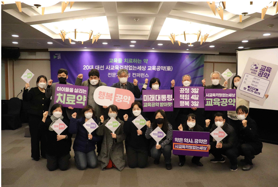
컨퍼런스를 마치고 참석자들과 찍은 단체 사진

사교육걱정은 이번 컨퍼런스를 시작으로 각 대선 후보들이 공정·책임·행복 교육을 실현하는 좋은 교육공약들을 만들어 국민들의 교육고통 해소 요구에 응답할 수 있도록 시민들과 함께 나설 예정입니다. 이를 위해 이번에 발표한 ‘3개 영역 11개 교육공약’에 대한 설문조사와 함께 100인의 시민들이 직접 후보들의 공약을 평가하는 과정도 거칠 예정입니다. 20대 대선에서 입시 경쟁 고통과 교육불평등 문제를 해결할 교육 공약들이 채택될 수 있도록 많은 관심과 참여 바랍니다.