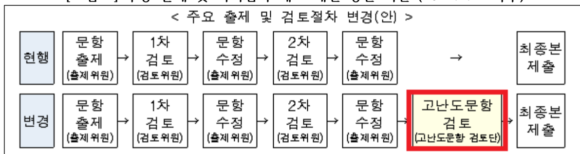
[그림 7] 수능 출제 및 이의심사 제도 개선 방안 시안 (2022.2. 교육부)

또한 근본적으로 이 문제를 해결하기 위해서는 국회와 정부 모두가 ‘킬러문항 방지법’ 제정을 위해 팔을 걷고 나서야 합니다. 역대급 불수능으로 불리는 2019학년도 수능이 치러진 이후 고교 교육과정을 벗어난 출제로 입은 피해를 국가가 배상해야 한다는 소송이 진행되었고 시민사회가 무수히 증거를 내놓아도 법 적용 대상이 아니라 심의할 수 없다는 법원의 최종 판단에