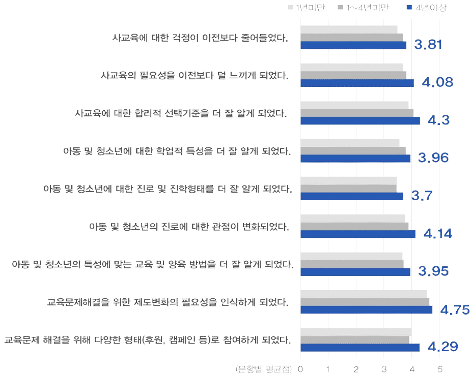
사교육걱정없는세상 활동기간에 따른 사교육절감 경험의 차이 (전체 484명)

■ 결과2. 사교육절감을 경험한 회원들의 단하나의 공통점 확인 : 사교육절감 경험 변화 핵심으로 기준이 분화되고 유연하게 되었다는 것이 뚜렷한 현상