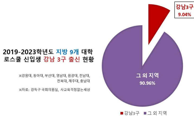
<그림3: 최근 5개년 로스쿨 신입생 강남 3구 출신 현황>

이러한 교육 격차는 국민들의 법 접근성 격차로 이어질 것입니다. 또한 교육 기회의 불균형, 지역별 교육격차 심화로 이어질 것입니다. 관련 악순환이 반복되면 국민들의 삶과 국가 발전이 저해될 것이란 사실은 불을 보듯 뻔합니다. 정부 차원에서 이러한 문제의 실상을 명확히 하기 위해 주기적으로 데이터를 수집·분석·발표해 나갈 필요가 있으며, 어떤 정책 구현으로 수도권과 그 외 지역 간의 교육격차를 줄여 나갈 것인가에 대한 국가 차원의 고민과 방안이 절실합니다. 그렇지 않고서야 윤석열 정부가 국정목표로 삼은 ‘살기 좋은 지방시대’, ‘수도권 쏠림-지방소멸의 악순환을 끊어내는 지속가능한 대한민국’은 실현될 길이 없습니다.